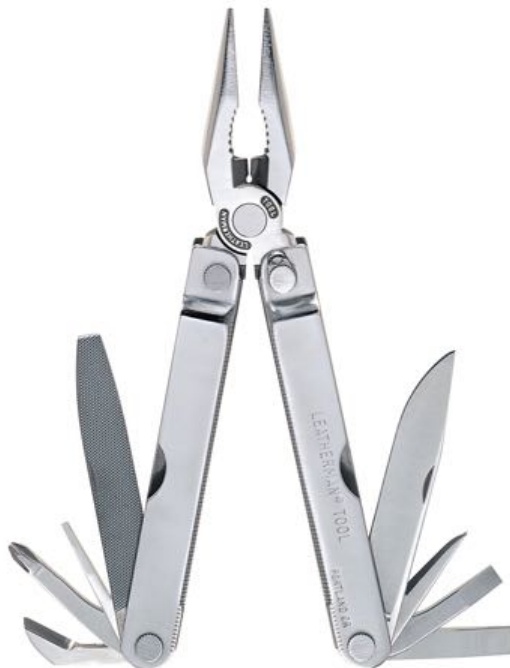
Pocket Survival Tool

szokás érteni. Ezek legfőbb jellemzője, hogy általában egy fogó szerszámot, és különböző egyéb funkciókat (késeket, csavarhúzókat stb.) ötvöznek egy kompakt méretű, könnyen hordozható szerszámban.