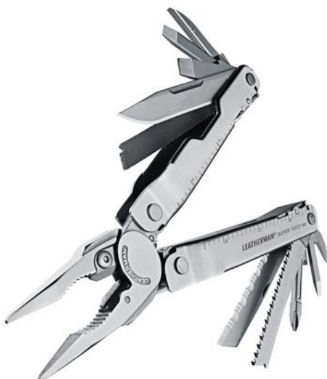
SUPER TOOL 300

A Rebar-ral funkcióiban teljesen megegyező, de méretében nagyobb Super Tool 300 -at azoknak ajánljuk, akik az átlagosnál nagyobb tenyérmérettel rendelkeznek, és/vagy extrém erőkifejtésre képes szerszámra van szükségük.